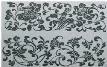
图3 中国古代蔓草吉祥图案

缠枝纹装饰纹样也经历了漫长的发展演变过程,早期为忍冬纹,东汉开始出现,流行于南北朝。忍冬纹呈翻卷状侧面三叶样式,主要为连续形波状结构,具有写实性,因其凌冬不凋,而比作人的灵魂不灭,轮回永生的吉祥寓意,后历经时代演变发展而成蔓草纹,逐步被取代。蔓草,其形态特征为滋长延伸、蔓延不断,寓意茂盛、长久,蔓草纹饰以蔓生植物的枝茎作连续的“S”形波状曲线排列,形成波卷缠绵的基本样式,层次分明 [8] ,给人以缠绵不绝的形式美感。其构图繁简疏密,姿态婉转优美,至隋唐最为流行,称为“唐草”,寓意繁荣昌盛、绵延不绝,成为一种富有特色的装饰纹样。随着历史和装饰艺术的发展,在延续前代传统纹样形式的基础上把各种吉祥寓意的花朵结合在缠枝纹里,逐渐形成缠枝花纹样。毛绒地毯多以藤蔓缠枝吉祥纹饰做边围装饰,烘托主花卉纹饰特质和寓意,形成协调统一富有韵律美的地毯图案。图3为中国古代吉祥图案中蔓草的形态演变。