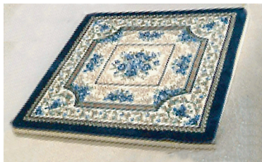
图 5 富贵迎春针织毛绒地毯

将花卉图案分隔为 3 个区域:中心区域为折枝牡丹,区域边角和边围由迎春花暗纹组成;第 2 层区域在垂直及四角均有折枝牡丹和迎春花暗纹与中心花卉对应,内框底纹配以迎春花,寓意迎春花开,中间细道边采用连续的几何纹饰方胜纹,为地毯图案整体效果增添了华美之感,使主体图案更加鲜明突出,寓意同心相连、优胜祥瑞、延续不断;花卉外围第 3 区域由蔓草纹环绕,四角由蔓草环绕折枝牡丹,外道边由春芽细小图案围绕,体现出春意盎然、富贵花开、幸福绵长的美好祝愿。整幅图案花型对称均衡、内外呼应、统一和谐。牡丹花雍容华贵,迎春花细春芽充满生机,蔓草婀娜多姿、生动优美,整幅图案充满了富贵吉祥、生活美满、幸福绵长的美好祝福。适合放置在客厅沙发主位,使整个空间充满了浓浓的吉祥寓意和传统文化气息。