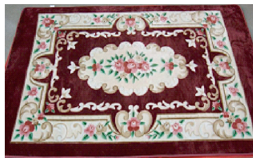
图 8 仿古典毛织地毯的针织毛绒地毯

毛绒地毯有别于传统古典毛织地毯,其以绒毛形式呈现,印花后经后道整理加工工艺,花纹细节无法呈现,因而需根据毛绒产品的特点将毛织地毯图形进行简化变形,以符合毛绒地毯特点,经简化后的结构图案的形、神与原图案一致,同样表达出相同的吉祥寓意,亦可以变形延伸。图 8 针织毛绒地毯,构图形式为美术式,中心区域为 1 簇折枝 5 瓣月季,椭圆形忍冬纹环绕其中;再由矩形忍冬纹和变形的连珠纹道边将图案分为 2 个区域;第 3 个区域由蔓草纹环绕,垂直和四角由蔓草环绕折枝月季,寓意春色永驻、富贵吉祥、五福绵长、福满四季。