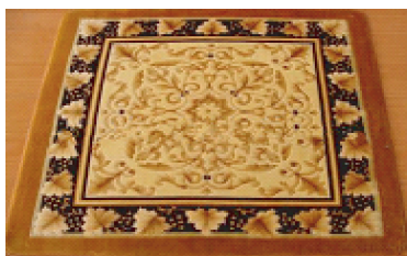
图 6 吉祥富贵子孙绵延针织毛绒地毯

图 6 为吉祥富贵子孙绵延针织毛绒地毯。构图样式采用京式地毯格律式,用简化的道边将图案分为 2 个区域。中心图案为传统京式地毯最为常用的吉祥花卉宝相花,中心采用八瓣对称连珠作基部,以构成宝相花花瓣元素桃形忍冬纹,勾卷瓣、云曲瓣为花瓣 [11] ;边围区域采用简洁的缠枝葡萄纹样。宝相花饱满华美,寓意福寿吉祥美满,葡萄枝叶蔓延婉转,盘旋流畅,富有动感,葡萄果实累累,纹饰极具装饰美感,表达了人们祈盼富贵吉祥、家庭兴旺、子孙绵延的美好愿望。整幅图案结构对称协调,结合针织毛绒产品特性,打破京式地毯多道边的严谨格式,进一步简化而又不失其平衡统一,整体图案简洁明快,将吉祥文化尽释演绎。