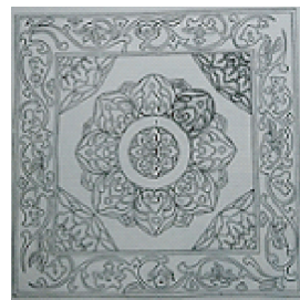
图4 中国古代宝相花藻井吉祥图案

贵、圣洁、美满、吉祥的象征,纹饰一般以花卉为主体,中间连有其他花叶,花蕊和花瓣基部用圆珠作规则排列,构成花心饱满结实,花瓣轮廓清新且富于变化,经艺术处理而形成的理想之花。宝相花形态千娇百媚仪态万千,将美的形式与富贵端庄、美满幸福的吉祥寓意相结合,成为寓美于形的传统吉祥纹饰,是我国传统纹饰中最具特色的宝花。中国的吉祥图案不追求自然形象的逼真摹写,而追求具有吉祥意义的抽象美和音律美,重视结构形式的律动和生命感 [10] 。这种吉祥图案的审美特征在宝相花纹饰中得以体现,其美的艺术形式和符号内涵形成具有浓郁的民族文化现象,几经发展与演变传承至今。图4为宝相花藻井图,以花草组合的宝相花图案,寓意春满乾坤、如意吉祥。