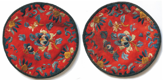
图 6 夏布绣圆枕顶

一样,江西传统夏布绣以动植物、戏剧人物及日常用品为题材,以比拟象征、谐音寓意及借用双关等手法,寓教于乐、寓情于景,生动形象地表达乡民世俗的美好愿望。戏水鸳鸯寓意幸福的伴侣;花瓶中插牡丹,“平”同“瓶”谐音,牡丹意富贵,联合起来即为“平安富贵”;牡丹、猫与蝶的组合,“猫蝶”谐音“耄耄”,寓意“耄耄富贵”。民间世俗的文化与现实的观念即是:加官进爵、长命富贵、子孙满堂 [13] 。枕顶上绣石榴、佛手、仙桃等纹样,寓意“多子、多福、多寿”。对于年轻姑娘而言,刺绣多以凤穿牡丹、喜鹊登梅、蝶恋花、鸳鸯戏水、刘海戏金蟾等为主,以刺绣寄托对未来美好婚姻生活的向往,构成其最美好的憧憬。图 6 为传统夏布绣枕顶花开富贵、蝶恋花。肚兜为贴身小衣,为承载年轻女性刺绣的最好载体。徐珂的《清稗类钞·服饰》释“抹胸,胸前小衣也。一名抹腹,又名抹肚,以方尺之布为之,紧束前胸,以防风之内侵者,俗谓之兜肚。” [14] ,夏布绣肚兜(图 3)是用天然植物染色的夏布为底,上用彩线挑绣,彩线红、绿、黄相间,图案繁复由蝶恋花、凤穿牡丹等组成,加以流苏配饰使其更具美观,图案寓意富贵、祥瑞,也寄寓美好的爱情。总体而言,传统夏布绣图案寓意韵味悠长,造型祛繁留简、平面化特征明显,无粗拙之态。