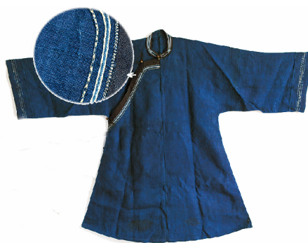
图1 斜襟上刺绣的夏布女上衣 Fig. 1 Grass ramie woman's blouse embroidered on slant opening

现江西省新余市夏布绣博物馆馆藏江西传统夏布绣50余件(套),从中看到这种民间绣活沿袭到现代的特色。民间绣活体现传统女性贤惠持家的能力,在生活实用品上的刺绣,一方面可以通过图案美化生活,起到祈福避祸纳吉的作用,另一方面,可以增强物品的耐摩擦牢度。夏布绣应用在服饰边襟、枕套、帐飘、荷包、围涎、肚兜、围裙、童帽等上,同其他民绣相比也有异曲同工之妙。绵远悠长的麻纺布衣,曾是平民百姓的主要服饰来源,其上的传统夏布刺绣保留有浓郁的乡土气息。图1为夏布绣博物馆